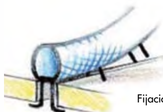
Fijación con clips

BP 87 - ZI du Devey - F 42000 Saint-Etienne Tel.: +33 (0)4 77 81 36 00 - Fax: +33 (0)4 77 81 37 00 silisol@omerin.com