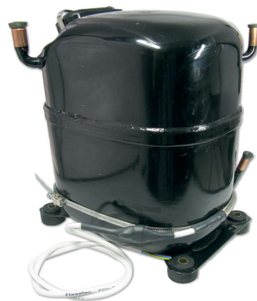
Abrazadera calefactora FCHK montada en un compresor