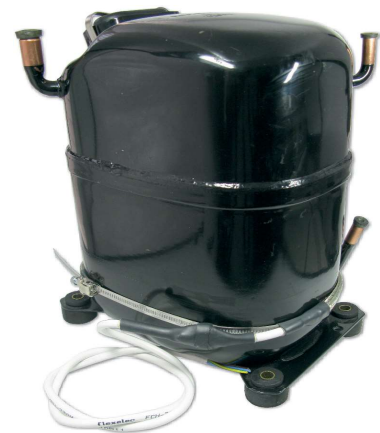
Ölsumpfheizung FCHK montiert auf Kälte-Kompressor